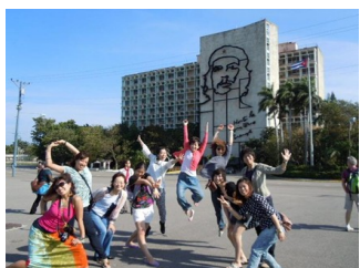
Delegación de Japón en el Congreso de Cuba 2013